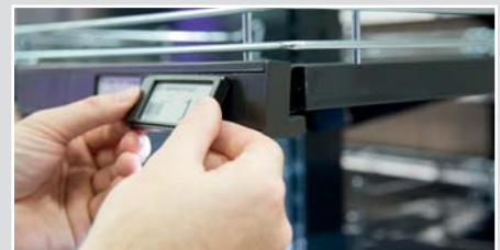
Der ESL-Strip von Umdasch Shopfitting verbindet eine optimale Befestigung am Fachboden mit Stromversorgung und Design sowie die Einbindung einer direkten Beleuchtung im Fachboden.

shop.up by Umdasch ist ein interaktives 3D-Planungsprogramm für Shops. Auf Basis moderner Visualisierungstechniken bietet shop.up eine adäquate Unterstützung für eine ansprechende state of the art Shop-Planung.