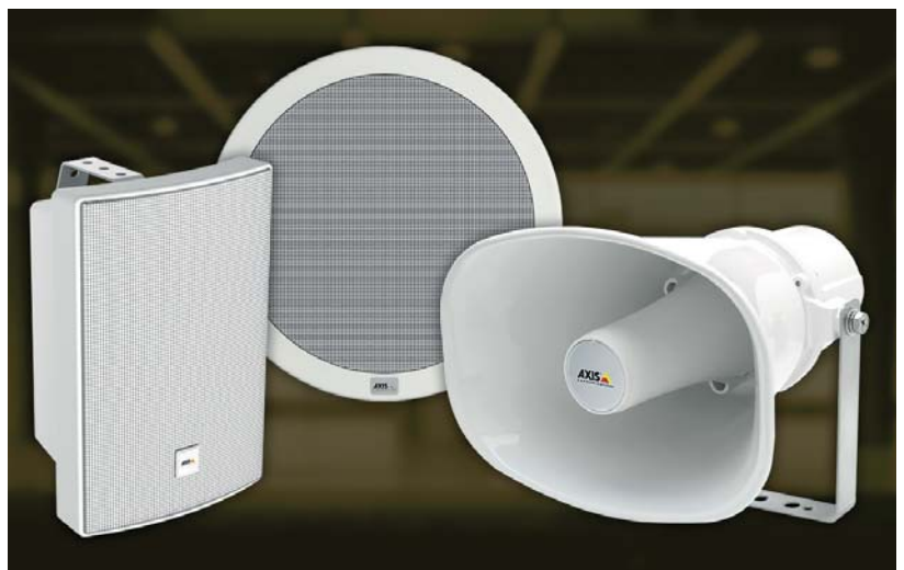
(v. links): Die AXIS C1004-E Netzwerk-Lautsprecherbox, der AXIS C2005 Netzwerk-Deckenlautsprecher und der AXIS C3003-E Hornlautsprecher sind vollständige, für den sofortigen Einsatz vorkonfigurierte Soundsysteme. Sie ermöglichen das nahtlose Streaming von Hintergrundmusik an mehreren Einzelhandelsstandorten.

Um zu zeigen, wie wichtig das Thema Sicherheit heute ist, zitierte Rech den sogenannten Optionsbleed-Bug im Apache-Server, der fatalerweise bei bestimmten Konfigurationen dazu führte, dass Apache-Server als Antwort auf