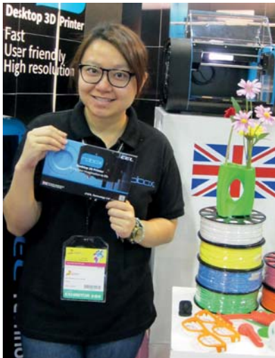
Unter anderem präsentierten die Hongkonger Jungunternehmer von CEL Technology Limited unter der Marke CEL Robox® einen 3D Drucker für Büro und Zuhause.