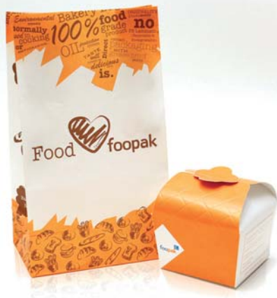
Das Sortiment des Unternehmens i-Deal Print Limited aus Hongkong umfasst Schreibwaren sowie Verpackungen für die Lebensmittelindustrie. In der Produktion wird ausschließlich recyceltes Papier eingesetzt.

Die „De Luxe Zone“ war ein weiterer Anziehungspunkt der Fachmesse. Hier fanden Besucher hochwertige Verpackungen für Luxusgüter und designorientierte Produkte. So stellte etwa das Hongkonger Unternehmen C & C Joint Printing Co., (HK) Ltd. ein breites Sortiment an Luxusverpackungen vor, unter anderem ausgerüstet mit RFID Technologien, die das Waren- und Bestandsmanagement erleichtern.