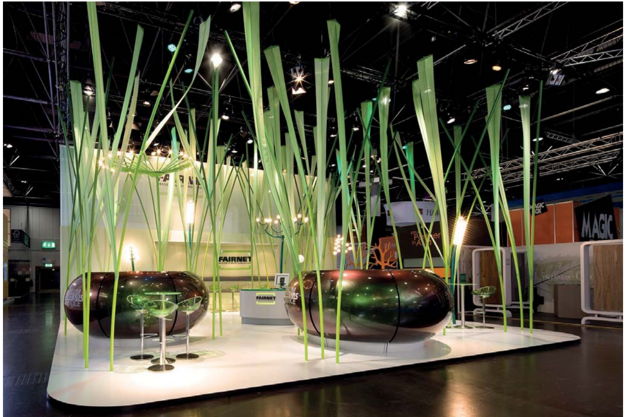
Inszeniertes Raumerlebnis, hier in der Umsetzung eines Messestandes der Fairnet GmbH.