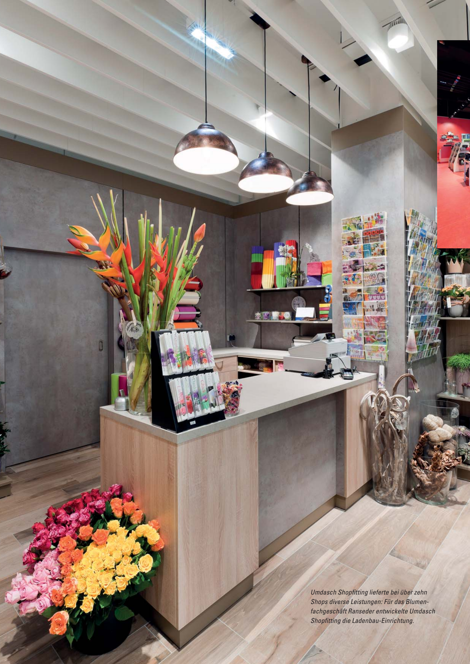
Umdasch Shopfitting lieferte bei über zehn Shops diverse Leistungen: Für das Blumenfachgeschäft Ranseder entwickelte Umdasch Shopfitting die Ladenbau-Einrichtung.